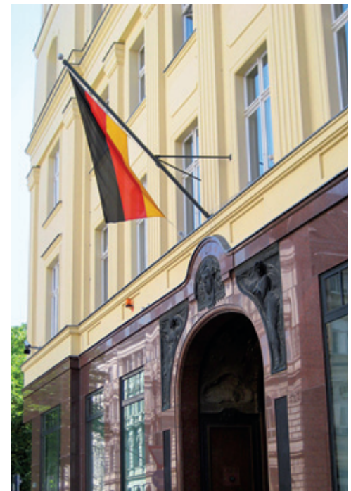
Büro des Wehrbeauftragten, Berlin