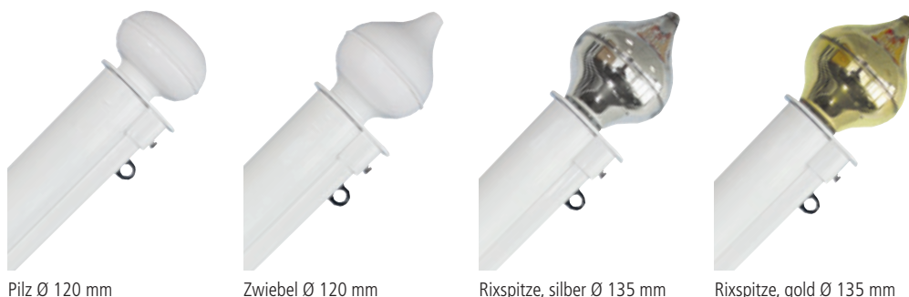
Pilz Ø 120 mm