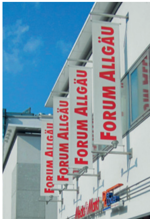
Forum Allgäu, Kempten