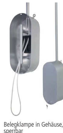
Belegklampe in Gehäuse, sperrbar

Pilz- und Zwiebelabschluß serienmäßig weiß, optional im RAL- oder DB-Ton der Rohre/Masten.