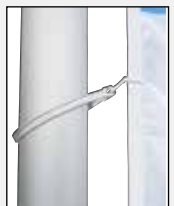
Die mittleren Karabiner in die Fahnenhaken einhaken.