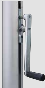
Kurbelhissvorrichtung alfa FlagLift ® , Handkurbel