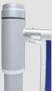
Mastkappe mit Rotor, Teleskopausleger

Hohe Diebstahlsicherheit Kurbelhisssystem alfa FlagLift ® Hoher Bedienkomfort