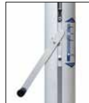
Kompaktantrieb, Handkurbel mit Entsperrstift