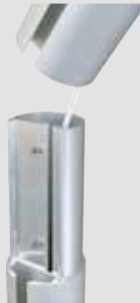
Steckstoß ZA75 2-teilig

5 Jahre Garantie auf Standicherheit der Mastrohre