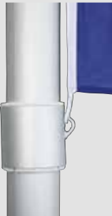
Zubehör: Fahnenstraffer, unverlierbar