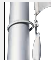
Den untersten Karabiner und das Fahnenstraffergewicht in das Fahnenstrafferband einhaken.