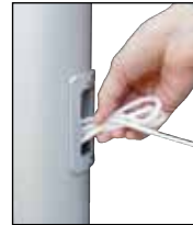
Nach dem Hissen Seil in Schlaufen legen und als Bund in das Bediengehäuse stecken.