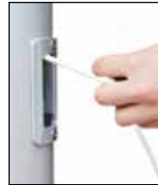
Hissen der Fahne durch horizontales Ziehen, Einholen durch Loslassen.

Die klassische Innenseilführung mit dem im Mastrohr laufenden PES-Hisseil. Die Handhabung des Hisseiles erfolgt über das Bediengehäuse mit (SchnellFixierSystem) alfa-SFS mit sperrbarem Türchen. Hissen und Abnehmen der Fahnen erfolgt durch Ziehen bzw. Nachlassen des Hisseiles. Bei Loslassen arretiert das Hisseil selbsttätig in der Spezial-Seilklemme im SFS-Gehäuse.