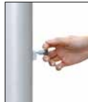
Entsperrstift ziehen, Riegel nach unten schieben: ENTSICHERN

Das patentierte Kurbel-Hissystem alfa FlagLift® besteht aus dem Kompaktantrieb mit VA-Antriebsrad, dem VA-Hisseil und dem Langschlitten mit Federvorspannung. Alle Bauteile befinden sich in der Mastnut. Die Seil-arretierung wird durch eine Federbremse bewirkt, die durch einfaches Anheben des Sicherungsriegels das Antriebsrad blockiert und den Steckerzugang für die Handkurbel verschließt. Die Entriegelung erfolgt mittels eines Spezial-Entsperrstiftes in einem Handgriff.