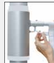
Fahne auf Auslegerrohr aufziehen und obersten Karabiner in Rotoröse einhaken.