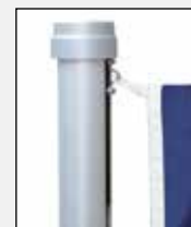
Obersten Fahnenkarabiner in Öse des Zugschlittens einhaken.

Es können alle gängigen, frei auswehenden Fahnen gehisst werden. Die maximal zulässigen Fahnengrößen sind unter den technischen Daten aufgeführt. Abgespannte Bannerfahnen sind grundsätzlich ab 7 Beaufort (50 – 61 km/h) Wind abzunehmen.