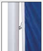
Mittleren Karabiner in die Ösen der Fahnentuchhalter einhaken.