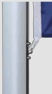
Zubehör: Fahnenstraffer, unverlierbar

5 Jahre Garantie auf Standsicherheit der Mastrohre