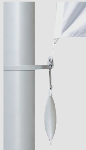
Fahnenstraffer- gewicht mit Fahnenstrafferband