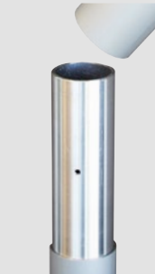
Steckstoß ZD75, ZD90, 2-teilig

5 Jahre Garantie auf Standicherheit der Mastrohre