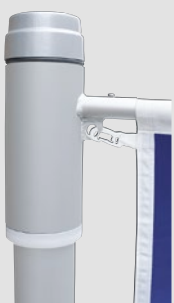
Mastkappe mit Rotor, Teleskopausleger