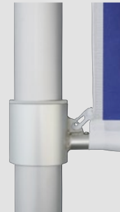
Zubehör, optional: Untenausleger