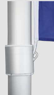
Zubehör, optional: Fahnenstraffer, unverlierbar